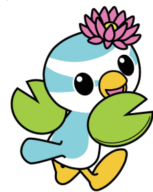
連田市マスコットキャラクター 「はすびい」 ©連田市