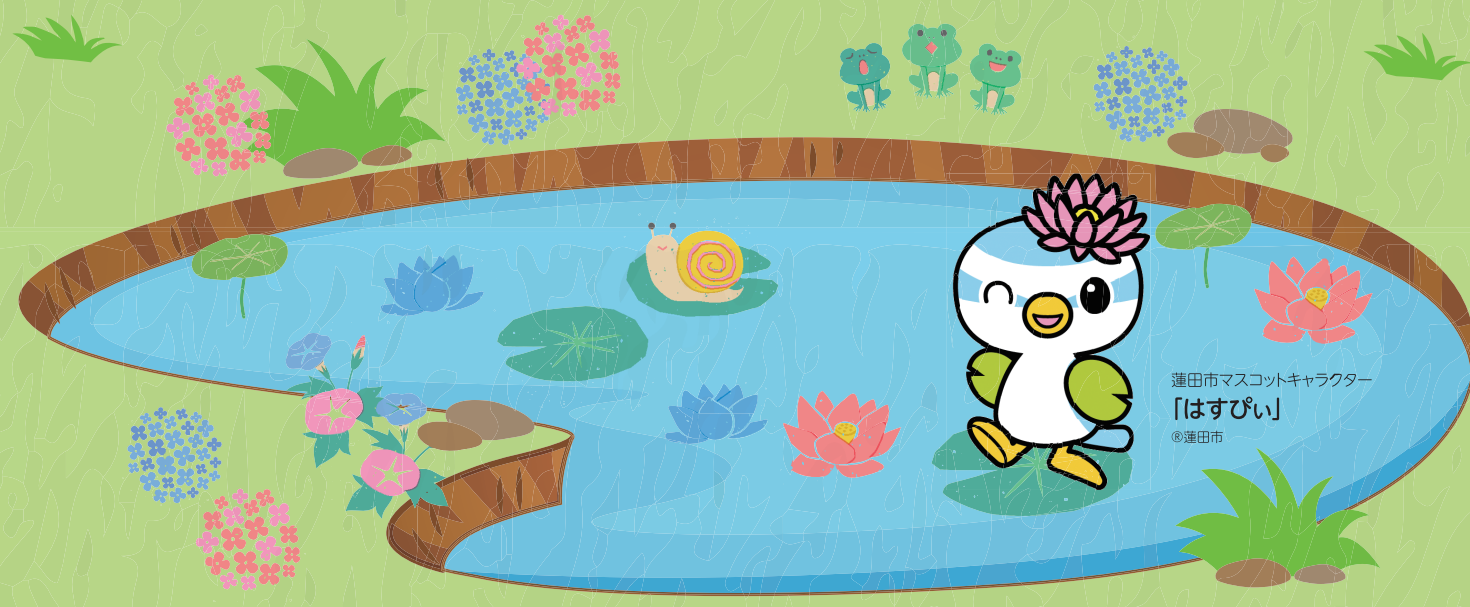
蓮田市マスコットキャラクター「はすびい」